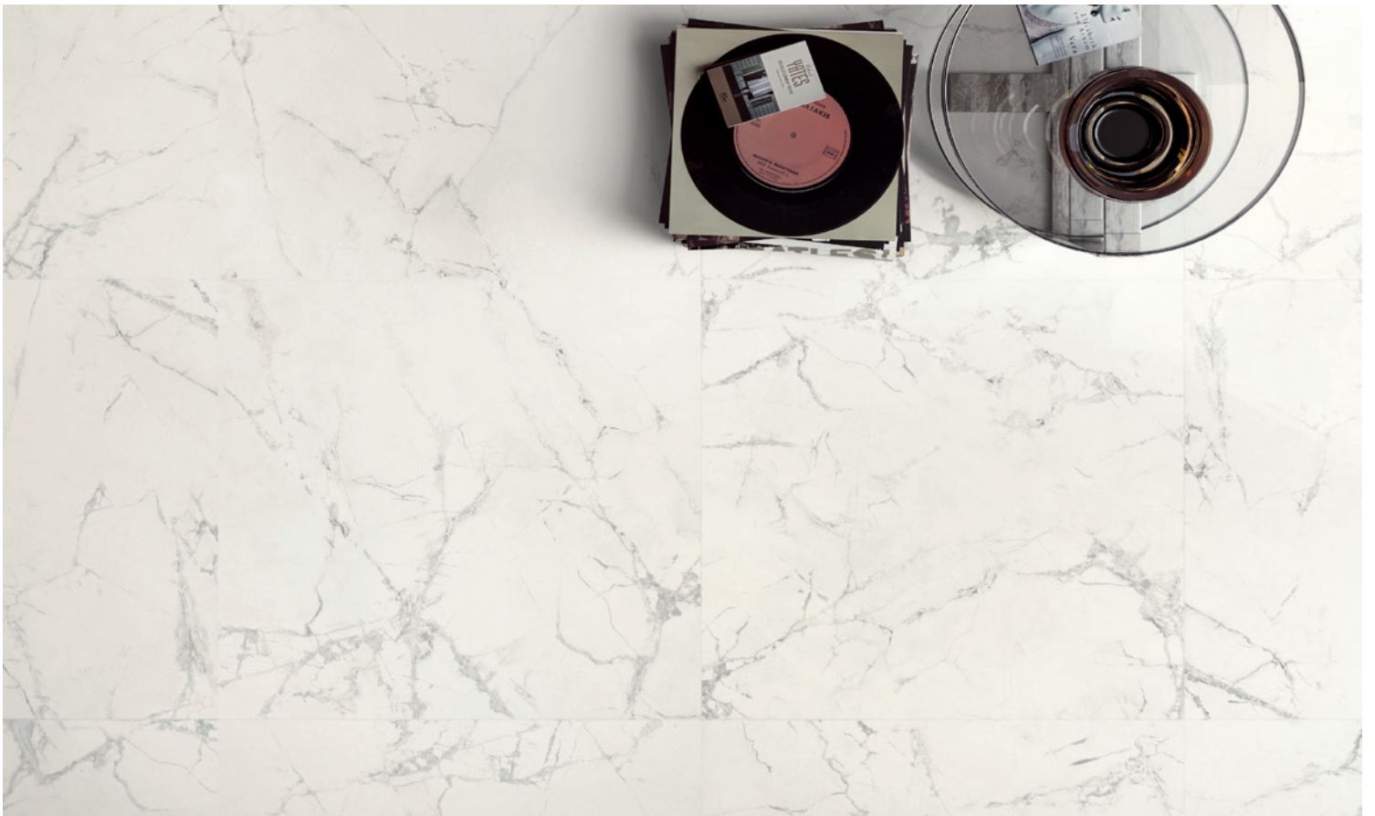
SPIDER WHITE (Blanc/Gris Foncé)