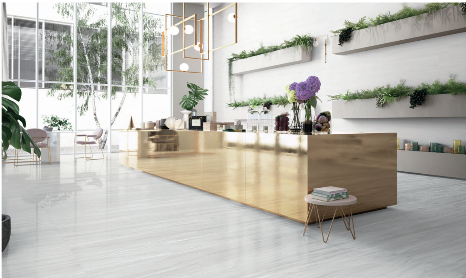
PALISANDRO SKY (Bleu/Gris)