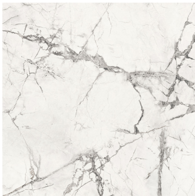
SPIDER WHITE (Blanc/Gris Foncé)